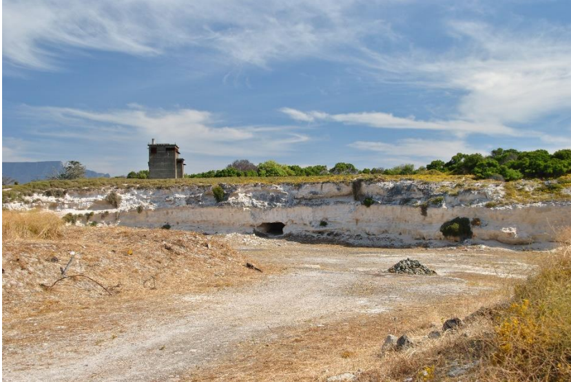
De steengroeve op Robbeneiland met in de achtergrond een deel van de Tafelberg

Zeer bijzonder was ook de steengroeve waar de gevangenen van het eiland moesten werken. In de kleine grotten die ontstonden door het loodzware hakwerk, moesten de gevangenen hun behoefte doen. De cipiers hielden zich hier verre van. Daardoor werden dit de enige plaatsen waar de gevangenen met elkaar konden praten. Een deel van de top van het ANC zat hier en kon zodoende met Madiba plannen maken. Dit hielp in hun strijd.